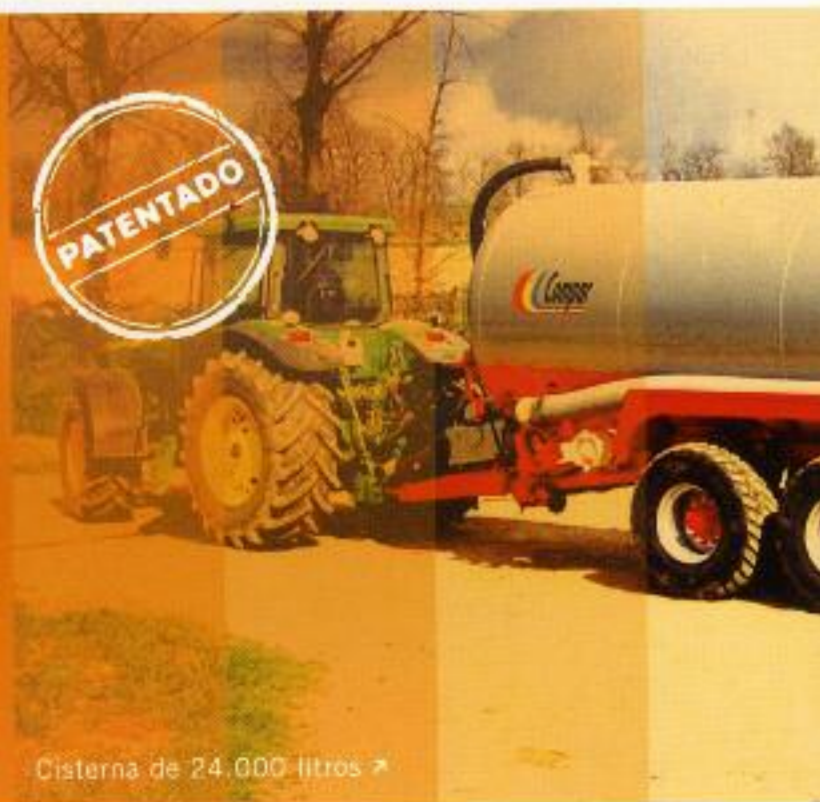
Cisterna de 24.000 litros >