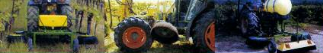
UNDAVINA 400 - Depósito 62 L - Montagem tração