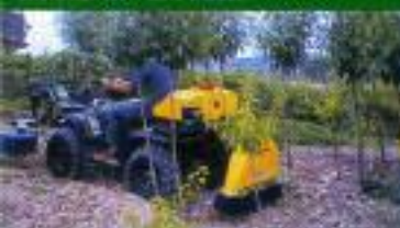
UNDAVINA - Montagem em plano (vinhas)