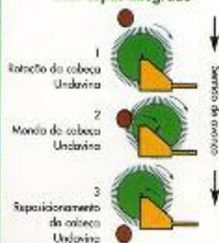
Vista esquemática da UNDAVINA ® , em operação

Sistema de Deservagem Inter-capas Integrado