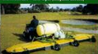
SPRAYDOME 5000 - Depósito 300 L (gêr)