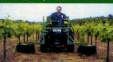
UNDAVINA 400 - Montagem tração em eixo 4x4