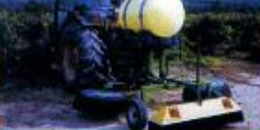
UNDAVINA 600 - Depósito 200 L - SPRAYMISER 1200