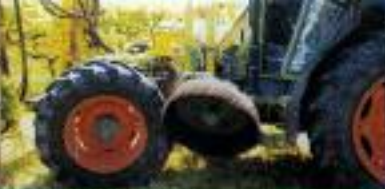
UNDAVINA 600 - Entre rodas em cavaleado