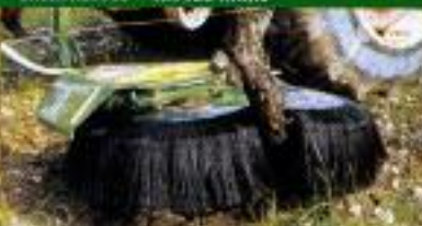
Sem derivações a 100%