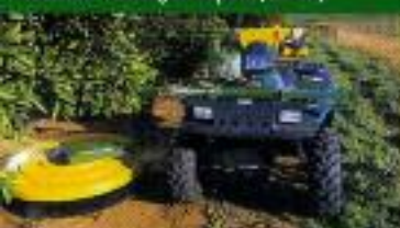
SPRAYMISER 1200 - (pomares)