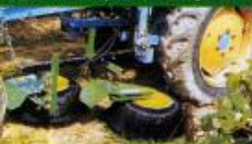
UNDAVINA 400 - Em tractor paralelo