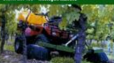
UNDAVINA 250 - Entre-cepas (carrilho estreito)