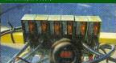
Controle independente por cabos