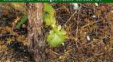
Uma selectividade perfeita