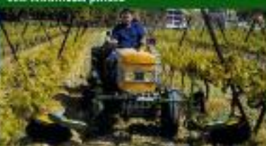
UNDAVINA 900 - Montagem diâmetro