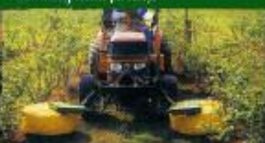
UNDAVINA 600 - (pomares)