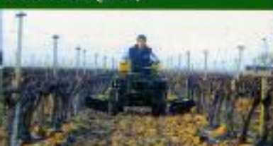
UNDAVINA 400 - (carrilho diâmetro)