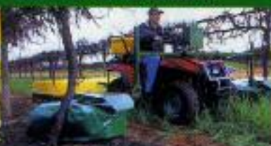
UNDAVINA 900 - Com sala vitícola