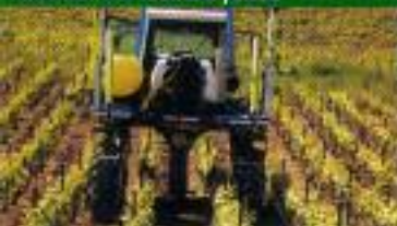
UNDAVINA 400 - Entre 2 linhas