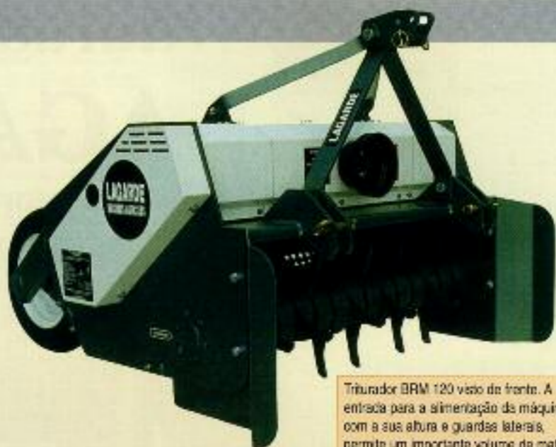
Triturador BRM 120 visto de frente. A entrada para a alimentação da máquina, com a sua altura e guardas laterais, permite um importante volume de material.