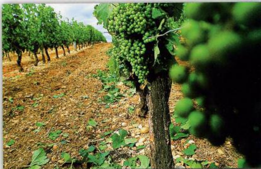
Un resultado impresionante, tanto sobre la vegetación como en el suelo