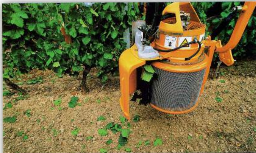
Las hojas son cortadas enteras con los peciolos

La velocidad de trabajo óptima se sitúa entre 4 km/h y 6 km/h , la intensidad del deshoje es ajustable desde el puesto de conducción, de suave a intensiva, e independiente para cada lado.