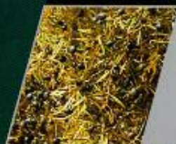
FB65 vibradores frontales