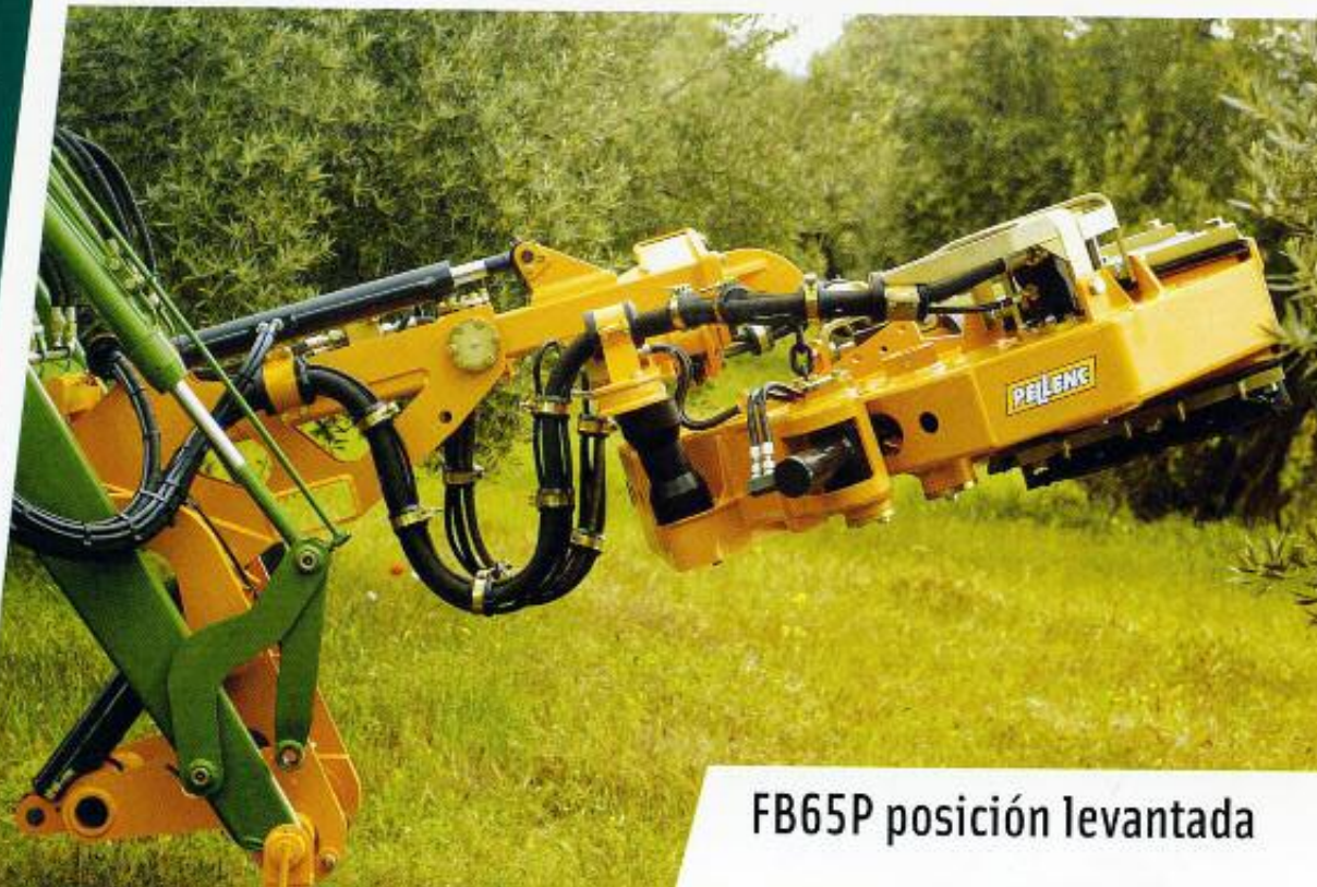
FB65P posición levantada