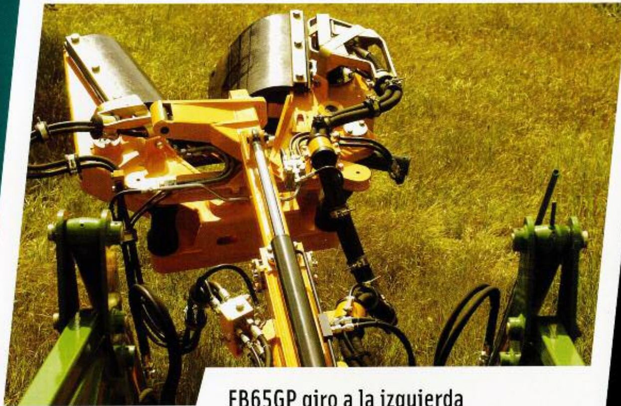
FB65GP giro a la izquierda