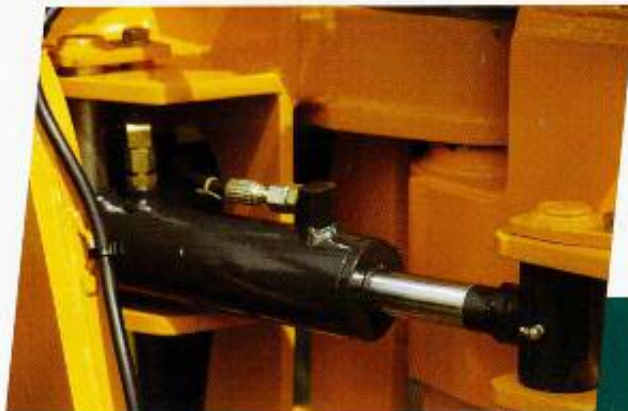
Botella de giro FB65GP