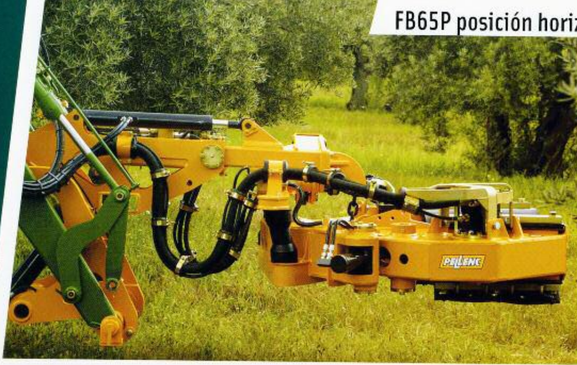
FB65P posición horizontal