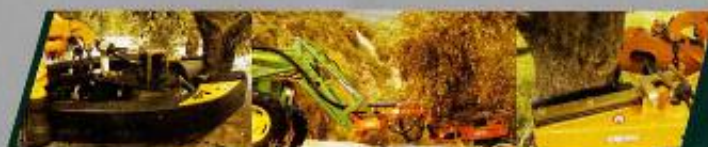
FB65 vibradores frontales

Teléfono: (091) 268 037 040 Tél. Fax 268 037 041 2104-203 ESTREMOZ