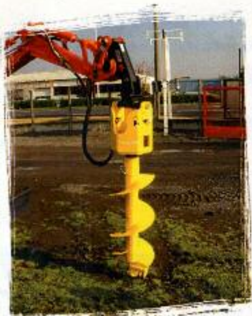
TRH 25 I & TRH 35 I especiales mini-excavadoras/compactas

TRH 25 I TRH 35 I TRH 50 I TRH 80 I TRH 120 I TRH 1500