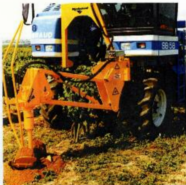
Kit Ahoyadora montada en una vendimiadora New Holland Braud