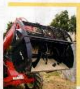
Cucharas mezcladoras y hormigoneras