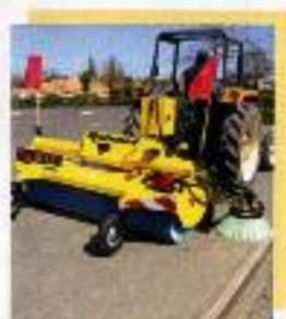
Barredoras para tractores