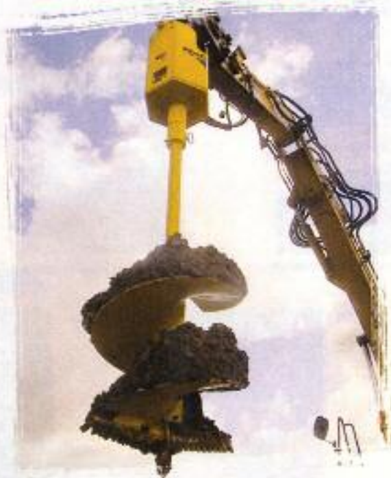
TRH 120 I & TRH 1500 especiales para cargadoras