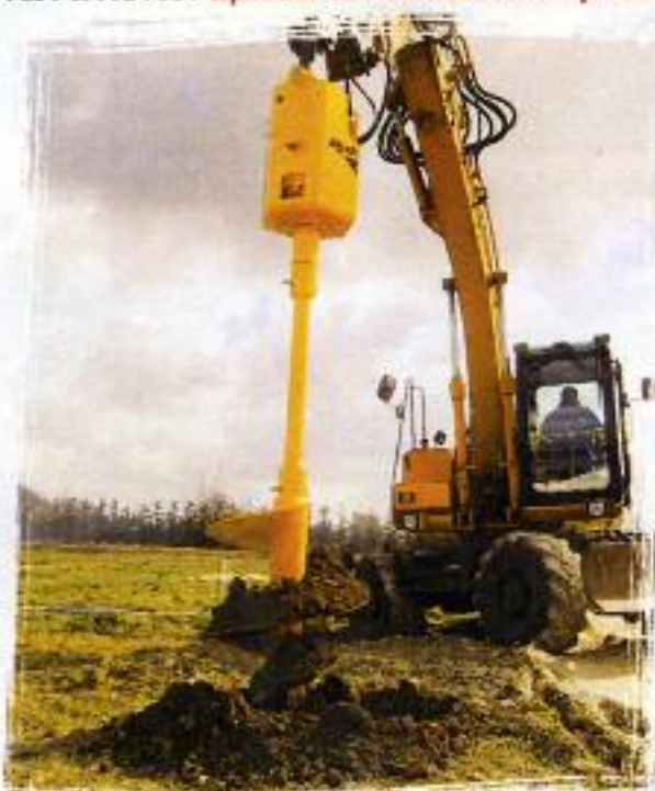
TRH 80 I especial para tracto-cargadoras/cargadoras