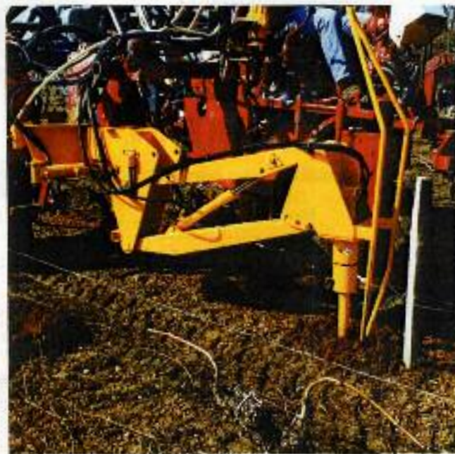
Kit Ahoyadora montada en un Tractor Zancudo (sin chasis de adaptación ni mando electro-hidráulico)