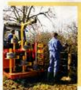
Colocadoras de malla y alambre de espino