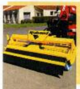
Barredoras para telescopios

RABAUD - Equipos profesionales para la construcción y obras civiles - es también :