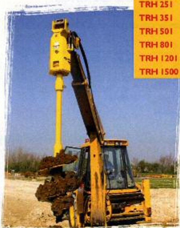
TRH 50 I especial para tracto-cargadoras/cargadoras