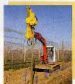
Clava-postes para mini-excavadora