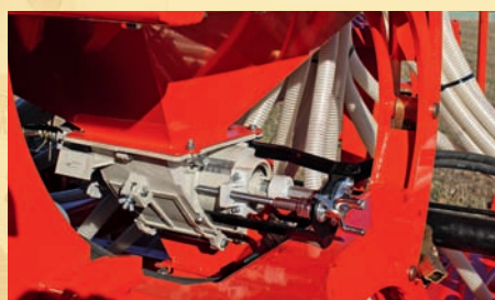
-SISTEMA DE DOSIFICACIÓN.