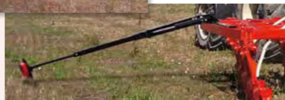
-MARCADOR LATERAL PLEGABLE HIDRÁULICO DE DISCO CON CONTROL DE PROFUNDIDAD.

Especificaciones sujetas a modificación sin previo aviso. Las ilustraciones no necesariamente muestran los equipos en su versión estándar.