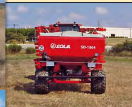
-MÁQUINA EN POSICIÓN DE TRANSPORTE A 3 m.