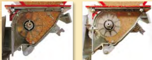
-REGULACIÓN SEMILLA NORMAL.