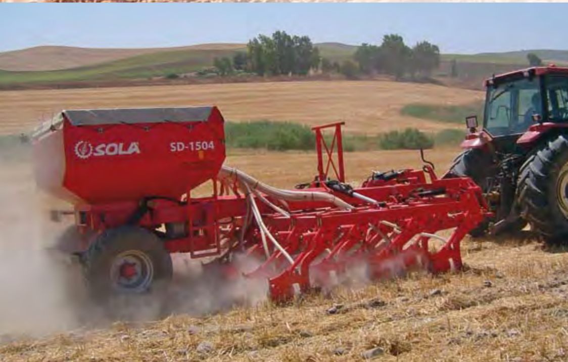
-VISTA GENERAL DE LA MÁQUINA SEMBRANDO.