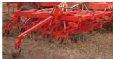
-MARCADOR PLEGABLE HIDRÁULICO DE REJA.