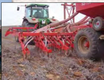
-DETALLES DEL BRAZO SEMBRANDO.