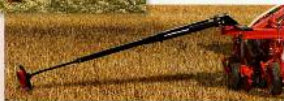
MARCADOR LATERAL PLEGABLE HIDRÁULICO DE DISCO CON CONTROL DE PROFUNDIDAD.

Equipamiento sujeto a modificación por parte de las instalaciones de mantenimiento, mostrar los equipos en su configuración.