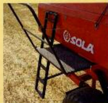
ESCALERA Y PLATAFORMA DE SERVICIO PARA MÁQUINAS DE 6 METROS.