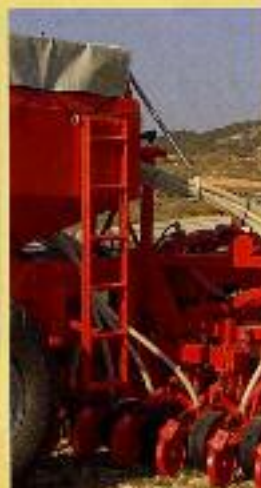
ESCALERA DE SERVICIO PARA MÁQUINAS DE 5 METROS.