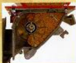
REGULACIÓN SEMILLA NORMAL