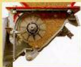
REGULACIÓN SEMILLA PEQUEÑA