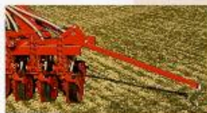
MARCADOR PLEGABLE HIDRÁULICO DE REJA.

TURBINA CON MOTOR HIDRÁULICO. TRAZADORES HIDRÁULICOS. KIT ABONO CON ESCALERA Y PLATAFORMA DE SERVICIO. ELECTROVÁLVULAS.