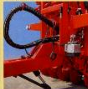
PÉ DE APOYO HIDRÁULICO MANUAL.