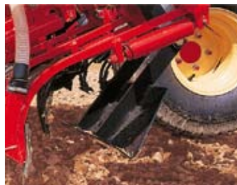
▼ -RUEDAS DE CONTROL DE PROFUNDIDAD EN LOS EXTREMOS.