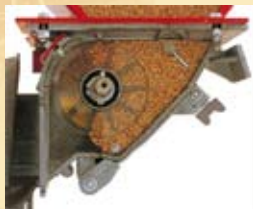
-REGULACIÓN SEMILLA NORMAL.