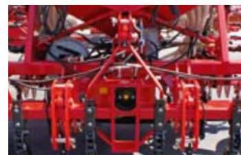
▲ -PREPARADOR DELANTERO CON TOMA DE FUERZA.