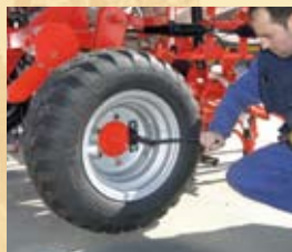
-CALIBRADO DE LA DOSIS A SEMBRAR.