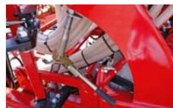
▲ -CHICHARRA REGULACIÓN DE PROFUNDIDAD.