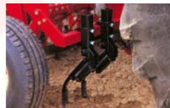
▲ -BORRAHUELLAS DEL TRACTOR.