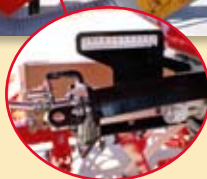
-AJUSTE DEL RODILLO DOSIFICADOR PARA SEMILLAS GRANDES O FINAS.