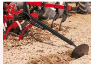
▲ -TRAZADOR HIDRÁULICO.