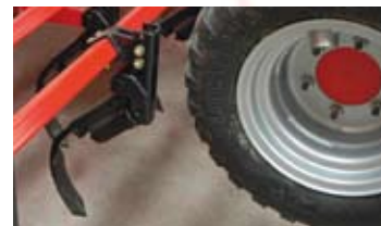
▲ -BORRAHUELLAS DE LA MAQUINA.