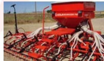
▲ -ESCALERA DE SERVICIO.