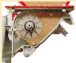
-REGULACIÓN SEMILLA PEQUEÑA.