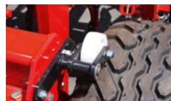
▲ -FRENO RUEDA MOTRIZ.