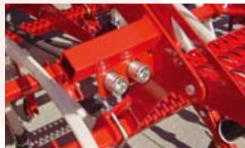
▼ -RASTRA TRASERA REGULABLE EN PROFUNDIDAD Y PRESIÓN.