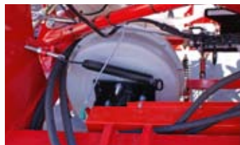
▼ -TURBINA CON MOTOR HIDRÁULICO.