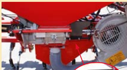
-CONJUNTO DOSIFICADOR CON INDICADOR DE CAUDAL DE SEMILLA.