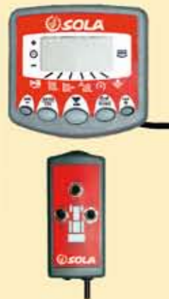
-MANDO ELECTRÓNICO CONTROLADO CON UN MONITOR DESDE CABINA QUE MANTIENE LA DOSIS CONSTANTE, INDEPENDIENTE DE LA VELOCIDAD DE AVANCE Y REGULABLE SEGÚN NECESIDAD.