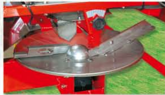
-DISCO INOX PARA 36 m. -BOQUILLA REGULABLE PARA LAS ORILLAS O REDUCCIÓN DE ANCHURA.