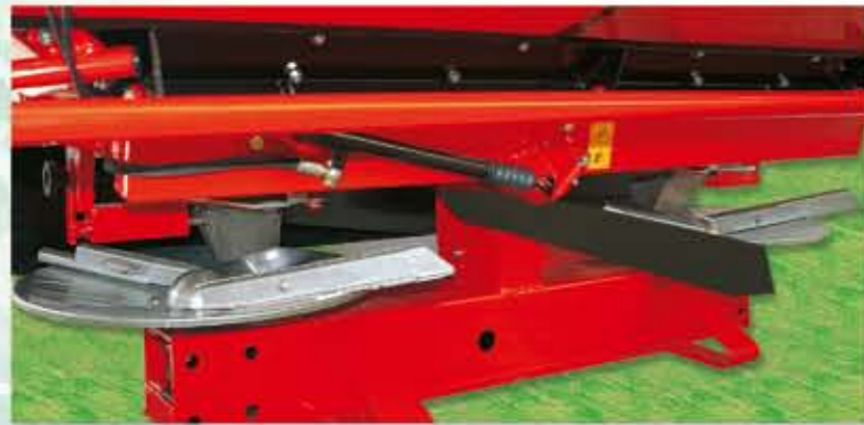
-DEFLECTOR HIDRÁULICO PARA EL ABONADO JUSTO EN LAS ORILLAS, SINCRONIZADO CON EL CIERRE SALIDA IZQUIERDA.