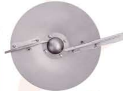
-DISCO INOX PARA 36 m.