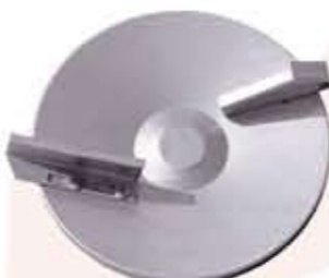
-DISCO ACERO INOX.