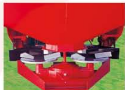
-GRUPO ESPECIAL SOLÁ.