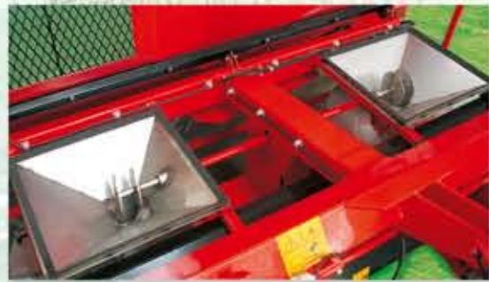
-FONDO TOLVA DE ACERO INOXIDABLE. -AGITADOR LATERAL DE GIRO LENTO (INOX).