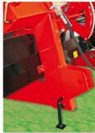
-PIE DE APOYO.