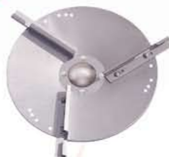
-DISCO INOX PARA 24 m.