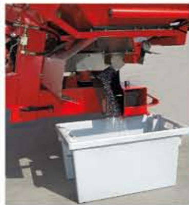
-KIT PARA EL ENSAYO DE LA DOSIS.